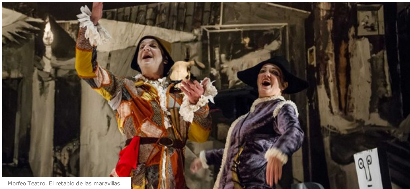
Morfeo Teatro. El retablo de las maravillas.